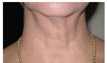
1回治療後、1ヶ月経過